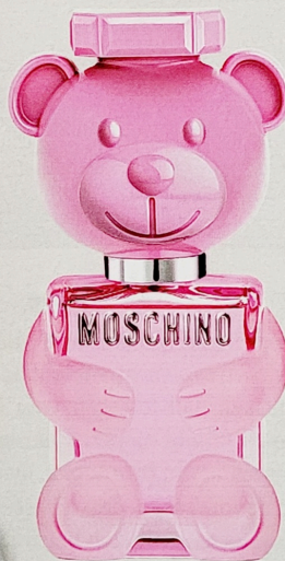
DUFTER TEDDY „Toy 2 Bubble Gum“, Moschino, EdT 50 ml, ca. 60 €

FARBE BEKENNEN Augen, Lippen und Nägel dürfen diesen Sommer ordentlich leuchten. BUNTE zeigt Ihnen, wie man Pink richtig trägt