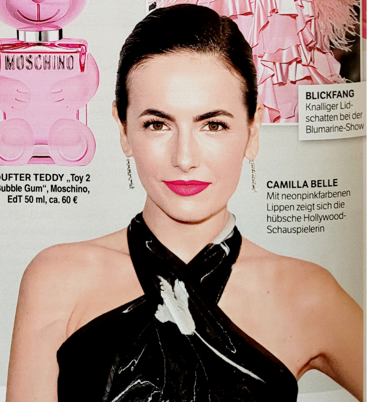
CAMILLA BELLE Mit neopinkfarbenen Lippen zeigt sich die hübsche Hollywood-Schauspielerin