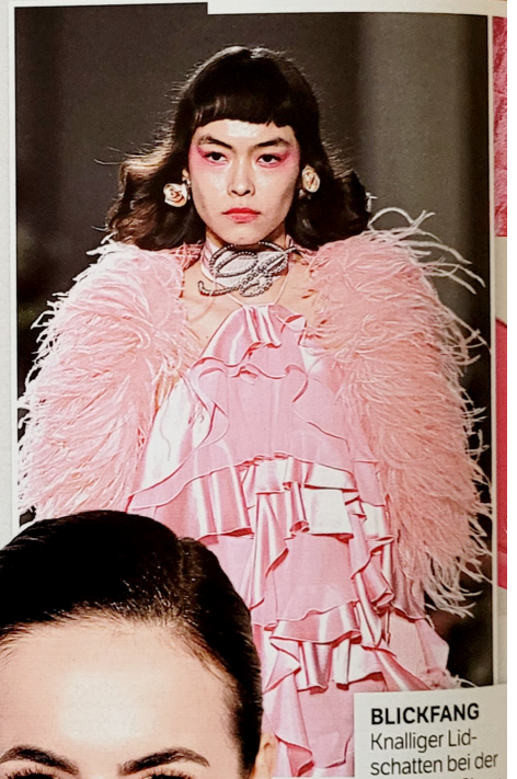
BLICKFANG Knalliger Lidschatten bei der Blumarine-Show