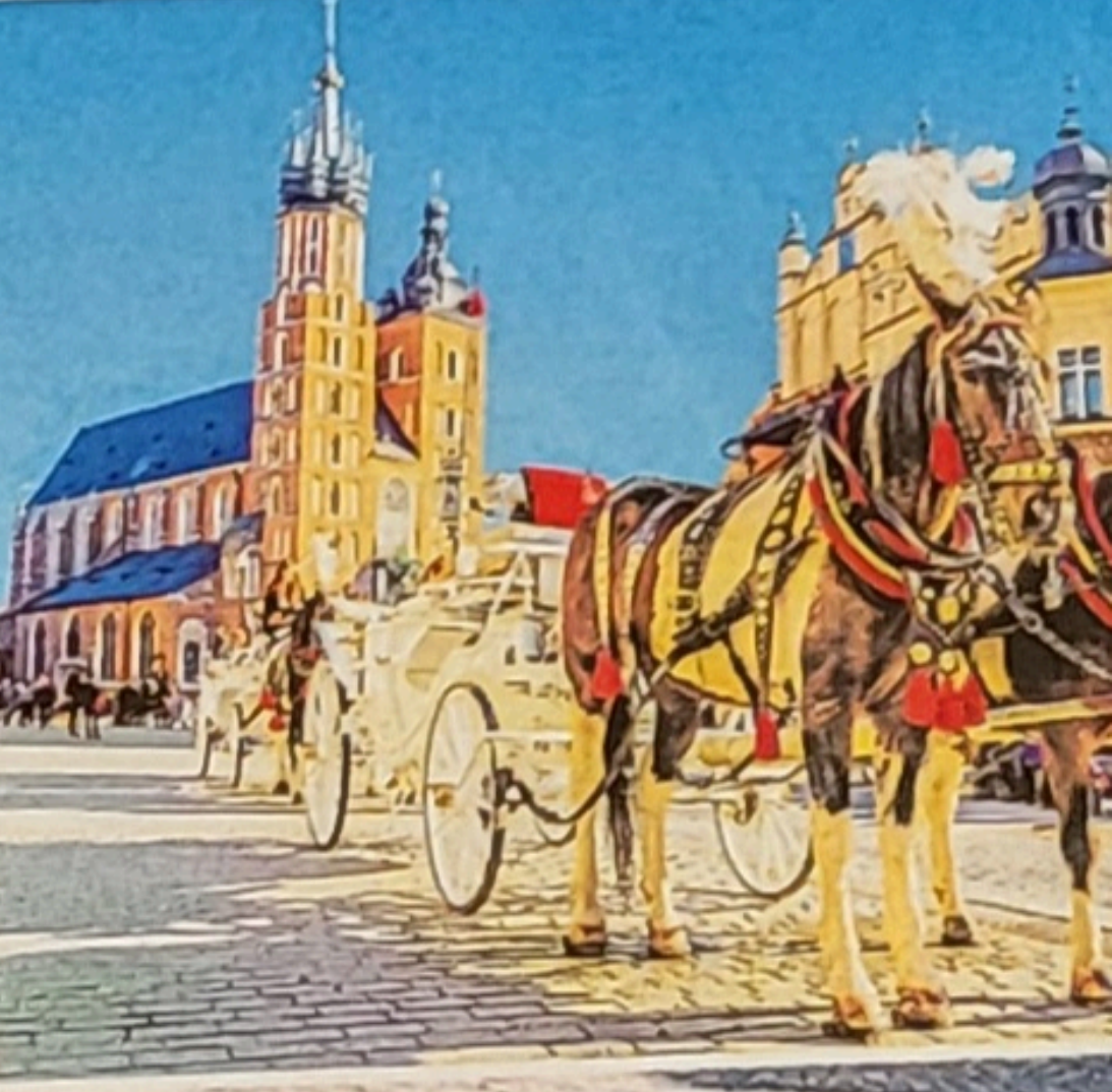
Eine Pferdekutsche fährt durch die bezaubernde Altstadt von Krakau

Erkunden Sie die vielfältigste Region Polens! Zusammen mit trendtours Touristik ( www.trendtours.de , Tel. 069/ 1200 9999), dem Spezialisten für Best-Ager-Reisen, verlosen wir die sechstägige Tour „Krakau und Schlesien“ im klimatisierten Fernreisebus für zwei Personen. Sie wohnen in ausgewählten Mittelklassehotels im Raum Breslau und Krakau, besichtigen diese architektonischen Juwelen mit deutschsprachiger Reiseleitung. Auch auf dem Programm stehen Ausflüge zum Kloster Jasna Góra in Tschenstochau sowie nach Kattowitz, Gleiwitz und Oppeln.