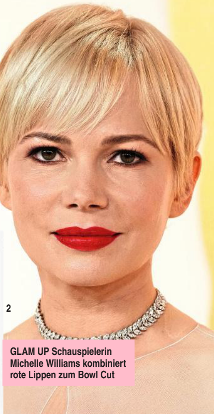
GLAM UP Schauspielerin Michelle Williams kombiniert rote Lippen zum Bowl Cut